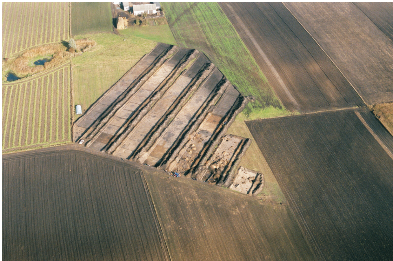
Fot. 3. Ludwinowo, stan. 3, pow. Włocławek. Zdjęcie lotnicze stanowiska w trakcie badań w 2004 roku.