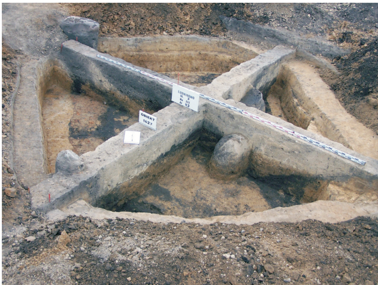
Fot. 31. Ludwinowo, stan. 3, pow. Włocławek. Obiekt 1627 – część piwniczna budynku mieszkalnego z późnego średniowiecza.