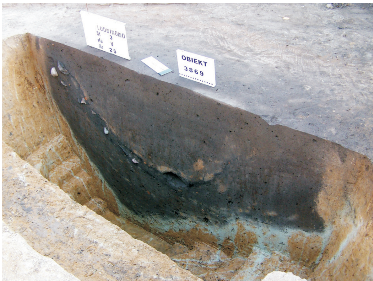
Fot. 16. Ludwinowo, stan. 3, pow. Włocławek. Obiekt 3869 – jama magazynowa grupy brzesko-kujawskiej kultury lendzielskiej.