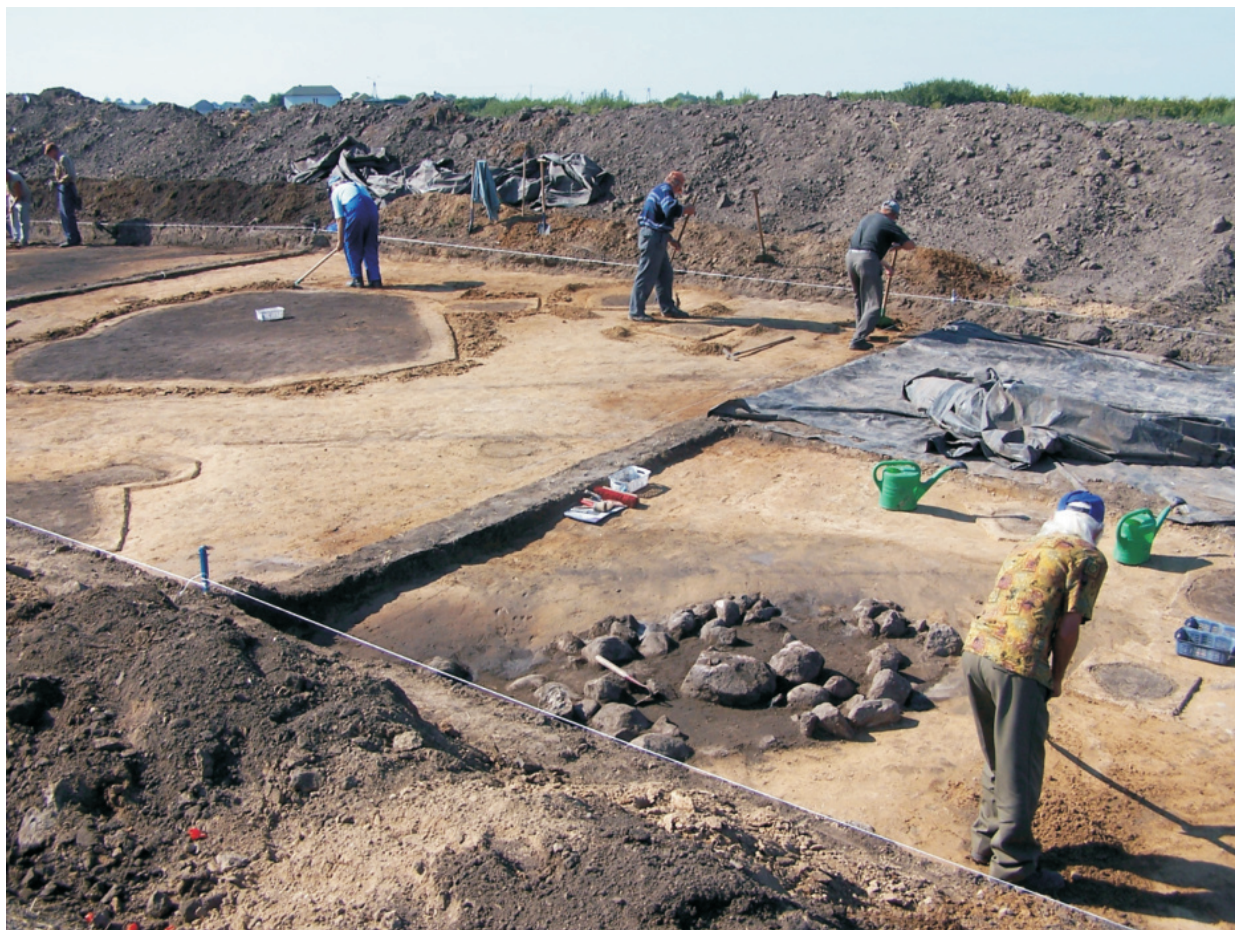
Fot. 6. Ludwinowo, stan. 3, pow. Włocławek. Prace eksploracyjne na wykopie w trakcie badań w 2005 roku.