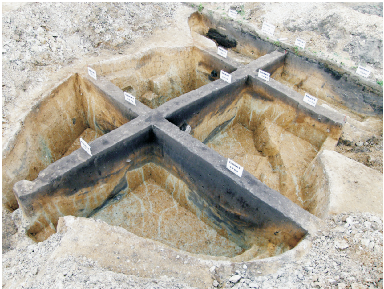
Fot. 18. Ludwinowo, stan. 3, pow. Włocławek. Zespół obiektów 5751-5754, 5837-5844, 5876 – jam wybierzyskowych grupy brzesko-kujawskiej kultury lendzielskiej.