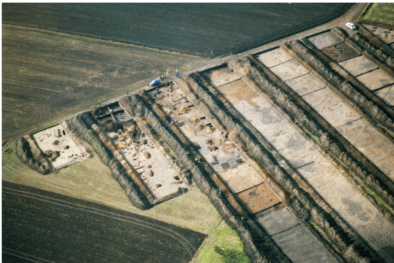
Fot. 4. Ludwinowo, stan. 3, pow. Włocławek. Zdjęcie lotnicze stanowiska w trakcie badań w 2004 roku.