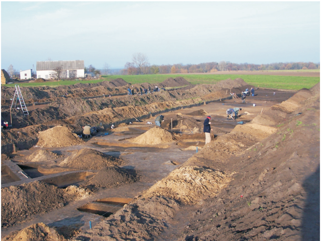
Fot. 9. Ludwinowo, stan. 3, pow. Włocławek. Prace eksploracyjne na wykopie w trakcie badań w 2004 roku.