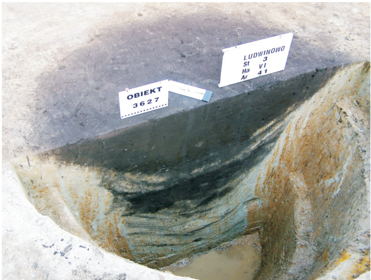
Fot. 17. Ludwinowo, stan. 3, pow. Włocławek. Obiektów 3627 – studnia grupy brzesko-kujawskiej kultury lendzielskiej.