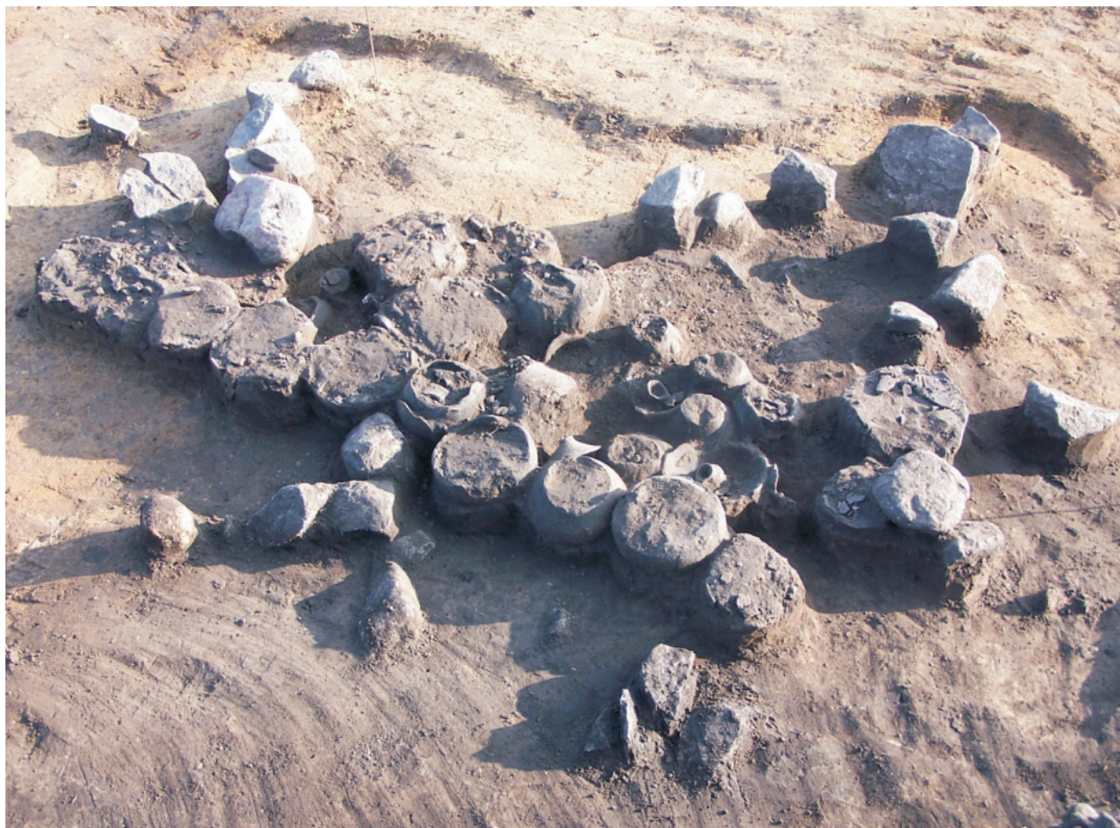
Fot. 22. Ludwinowo, stan. 3, pow. Włocławek. Obiekt 438 – grób zbiorowy kultury pomorskiej.