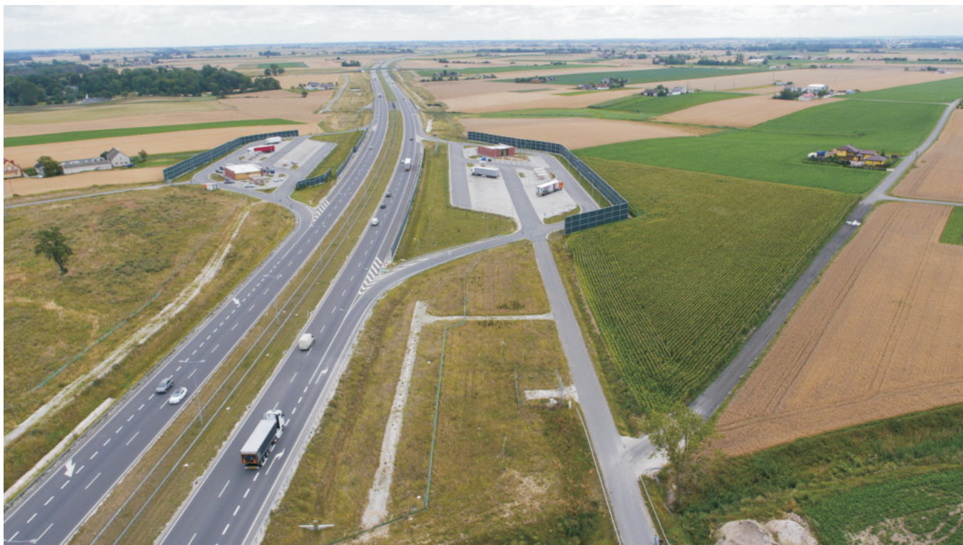
Fot. 1. Ludwinowo, stan. 3, pow. Włocławek. Zdjęcie lotnicze strefy stanowiska z wybudowaną autostradą A-1.