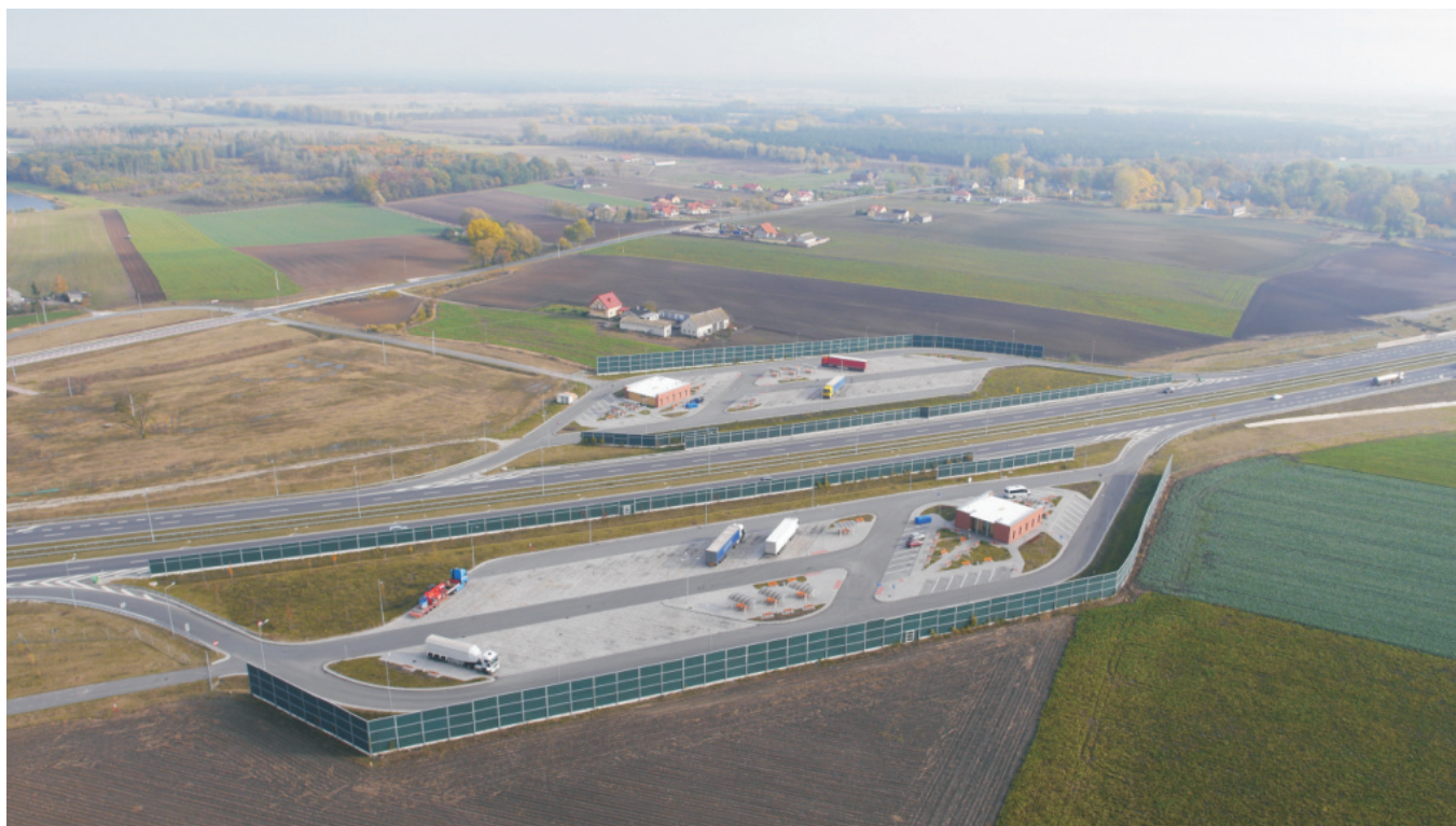
Fot. 2. Ludwinowo, stan. 3, pow. Włocławek. Zdjęcie lotnicze strefy stanowiska z wybudowaną autostradą A-1.