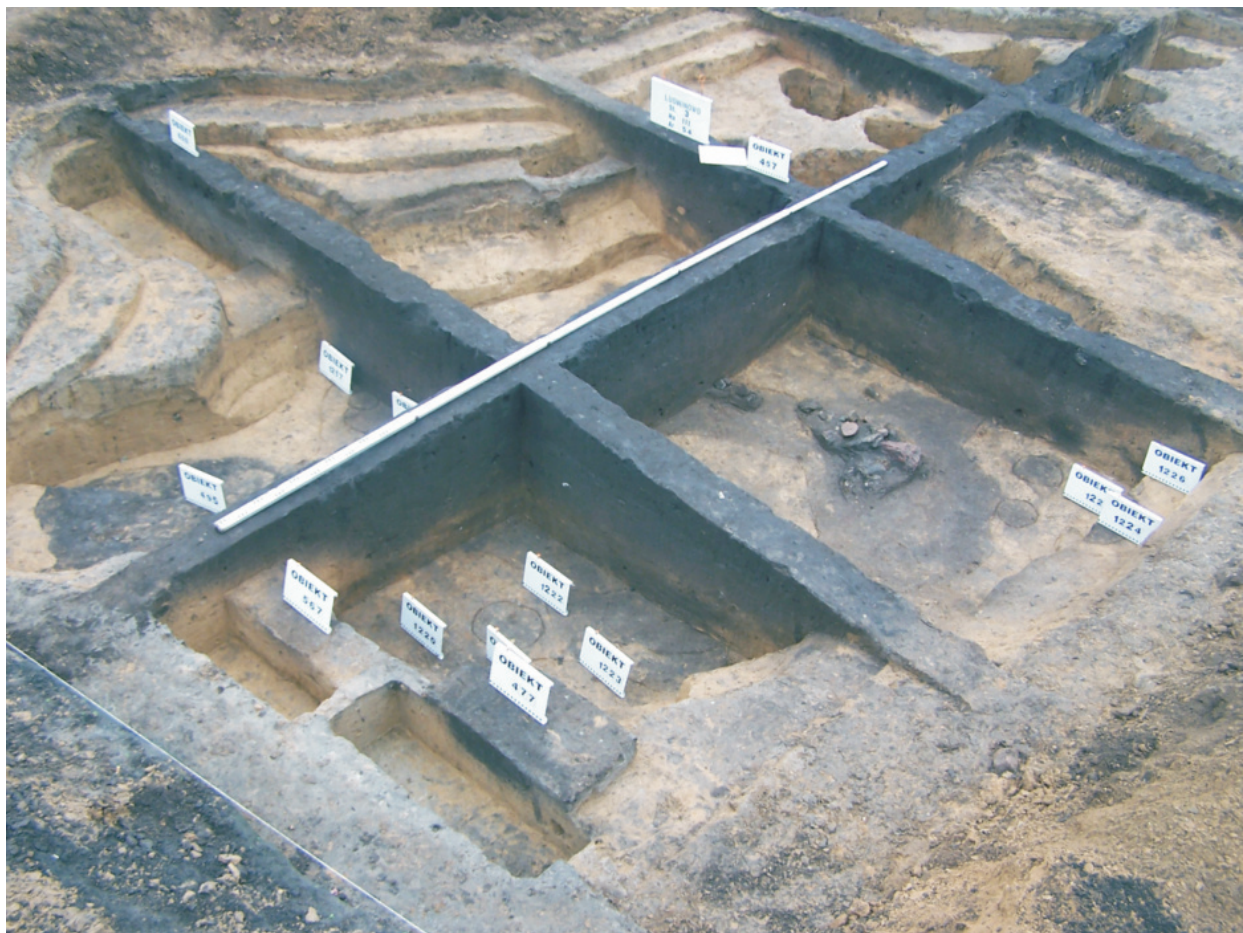
Fot. 25. Ludwinowo, stan. 3, pow. Włocławek. Obiekt 457 – budynek magazynowy kultury przeworskiej w trakcie eksploracji.