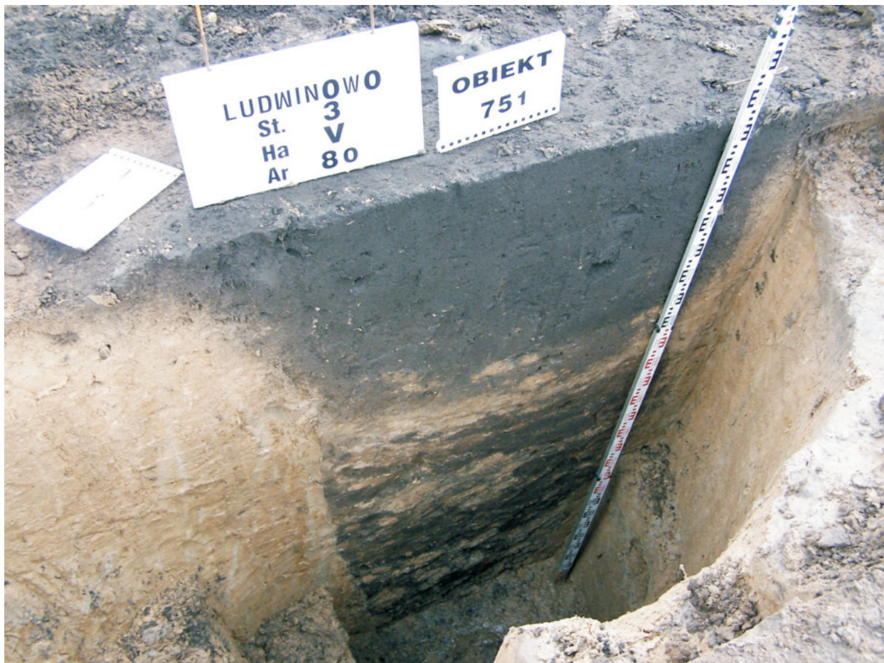
Fot. 27. Ludwinowo, stan. 3, pow. Włocławek. Obiekt 751 – studnia kultury przeworskiej.