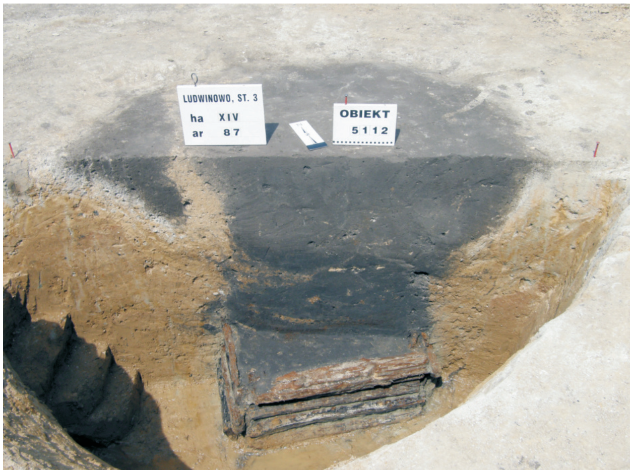
Fot. 34. Ludwinowo, stan. 3, pow. Włocławek. Obiekt 5112 – studnia z późnego średniowiecza.