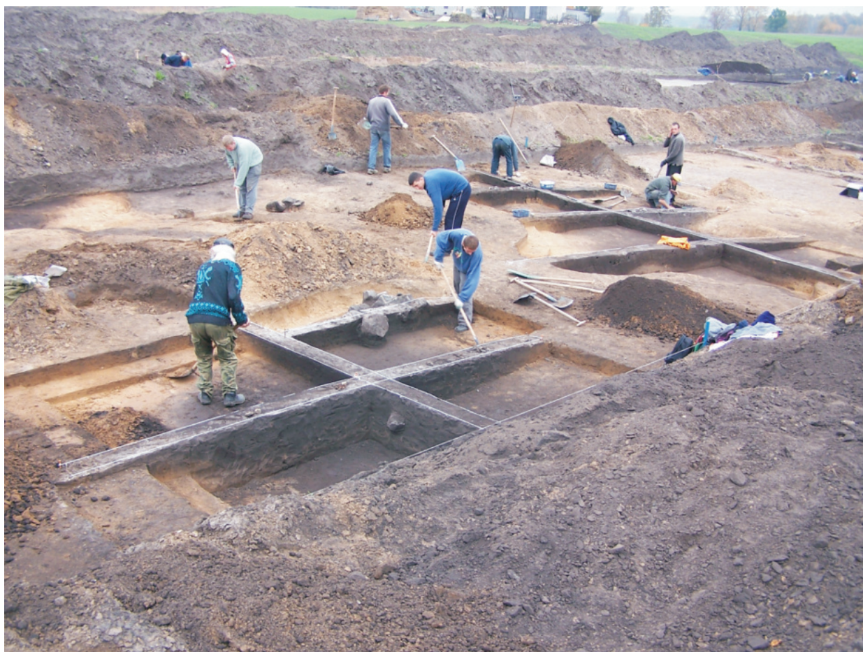
Fot. 5. Ludwinowo, stan. 3, pow. Włocławek. Prace eksploracyjne na wykopie w trakcie badań w 2004 roku.