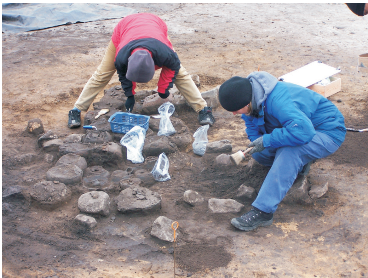
Fot. 12. Ludwinowo, stan. 3, pow. Włocławek. Eksploracja obiektu 438 – grobu zbiorowego kultury pomorskiej.