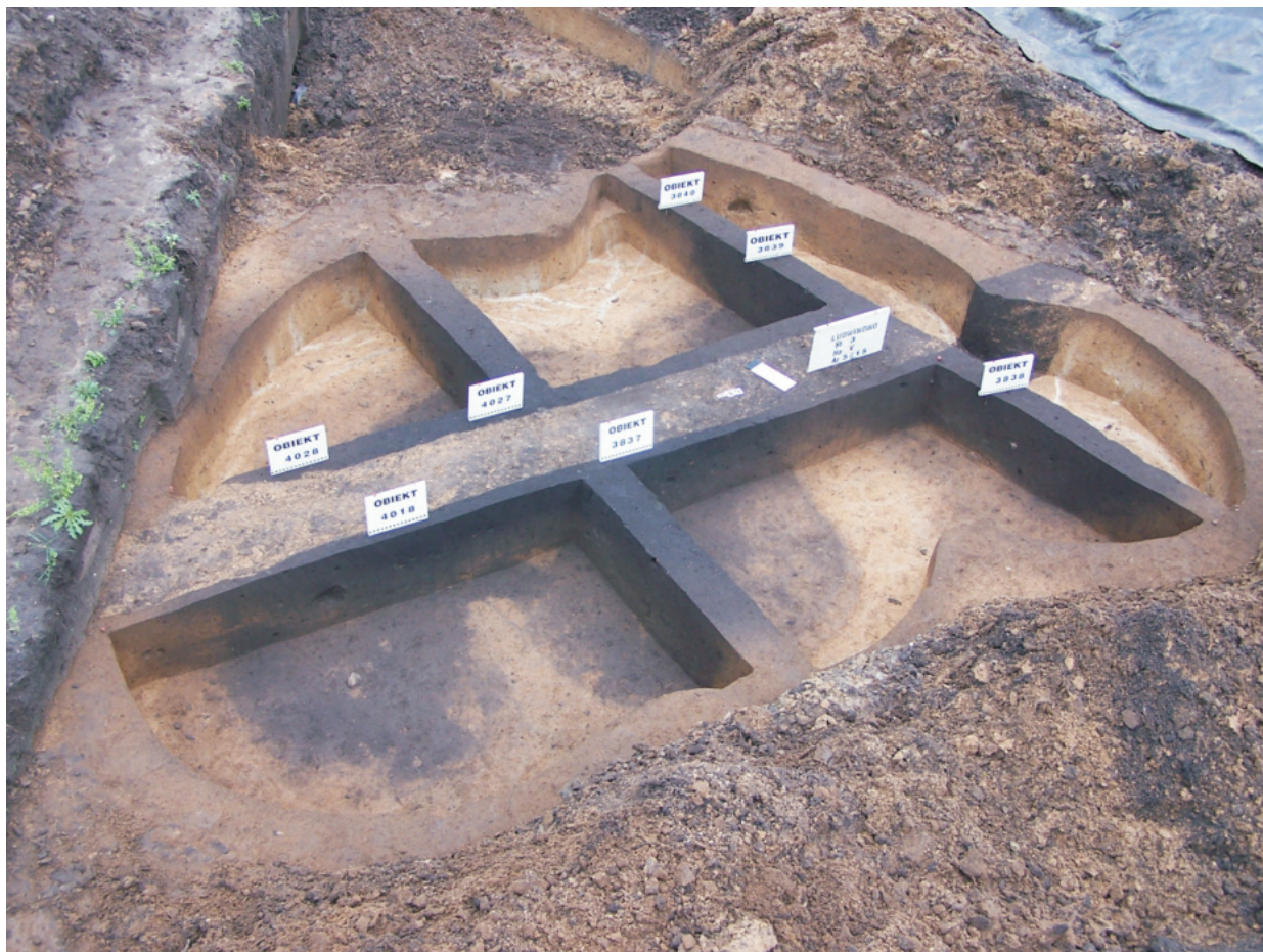
Fot. 15. Ludwinowo, stan. 3, pow. Włocławek. Zespół obiektów 3837-3840, 4018, 4027-4028 – jamy wybierzyskowych grupy brzesko-kujawskiej kultury lendzielskiej.