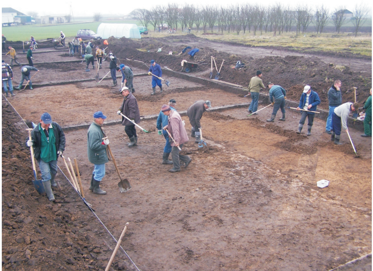
Fot. 10. Ludwinowo, stan. 3, pow. Włocławek. Prace eksploracyjne na wykopie w trakcie badań w 2008 roku.