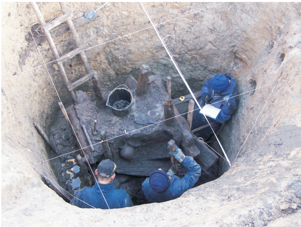
Fot. 11. Ludwinowo, stan. 3, pow. Włocławek. Prace eksploracyjne i dokumentacyjne studni późnośredniowiecznej – obiektu 356.