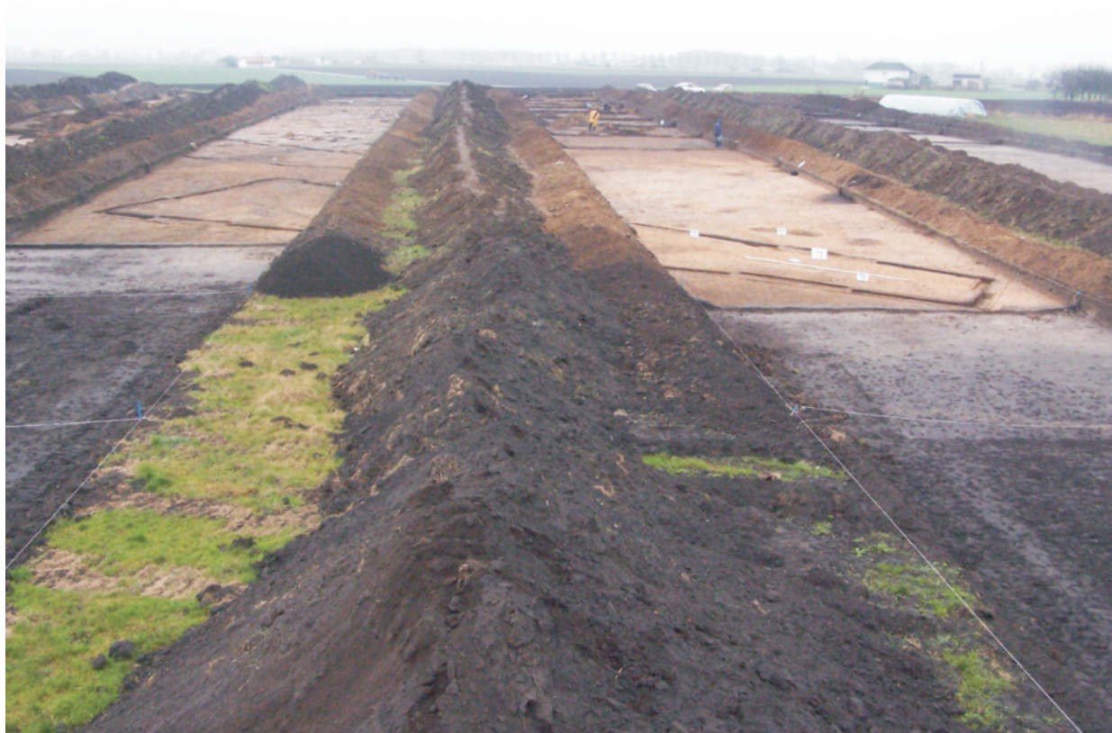
Fot. 13. Ludwinowo, stan. 3, pow. Włocławek. Ogólny widok na wykopy z 2004 roku z obiektem 950 - domem trapezowatym grupy brzesko-kujawskiej kultury lendzielskiej.