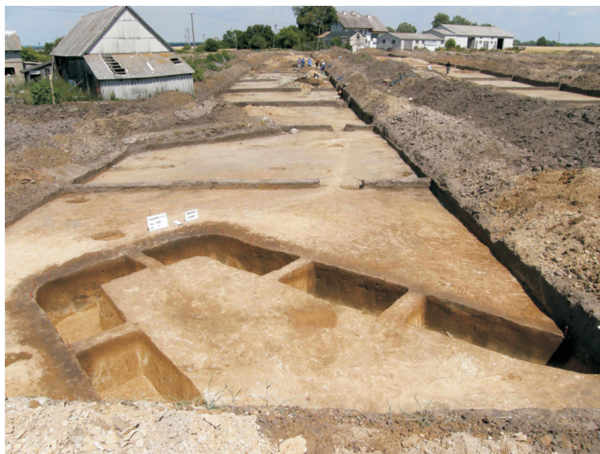
Fot. 14. Ludwinowo, stan. 3, pow. Włocławek. Obiekt 5445 – dom trapezowaty grupy brzesko-kujawskiej kultury lendzielskiej.