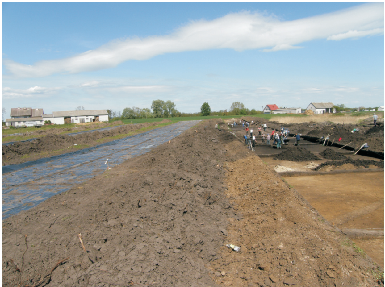
Fot. 8. Ludwinowo, stan. 3, pow. Włocławek. Prace eksploracyjne na wykopie w trakcie badań w 2008 roku.