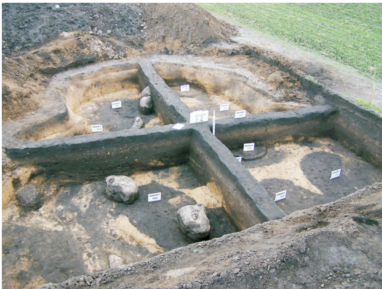
Fot. 24. Ludwinowo, stan. 3, pow. Włocławek. Obiekt 411 – glinianka kultury przeworskiej w trakcie eksploracji.