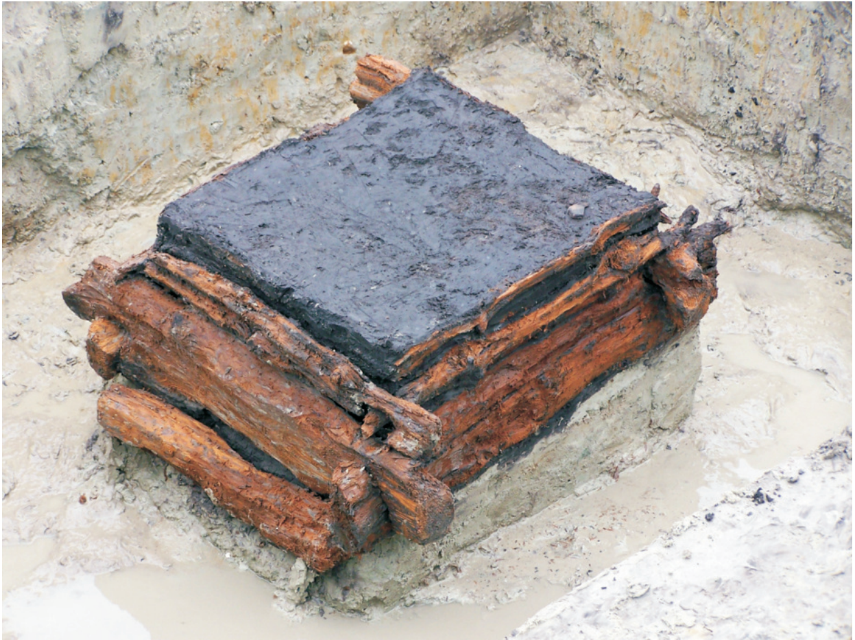
Fot. 33. Ludwinowo, stan. 3, pow. Włocławek. Obiekt 3075 – studnia z późnego średniowiecza.