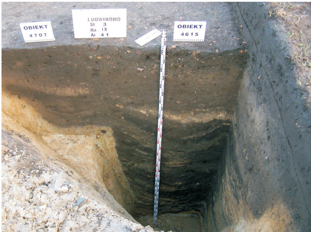
Fot. 28. Ludwinowo, stan. 3, pow. Włocławek. Obiekt 4615 – studnia kultury przeworskiej.