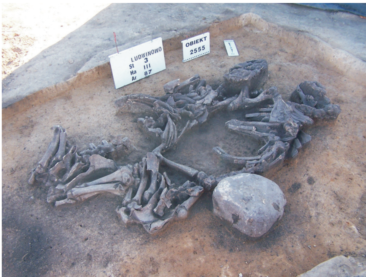
Fot. 20. Ludwinowo, stan. 3, pow. Włocławek. Obiekt 2555 – pochówek bydłocy kultury amfor kulistych.