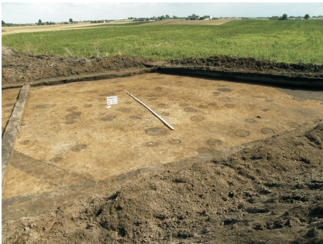
Fot. 23. Ludwinowo, stan. 3, pow. Włocławek. Jamy posłupowe w strefie budynków halowych kultury przeworskiej (ha IX, ary 14, 24).