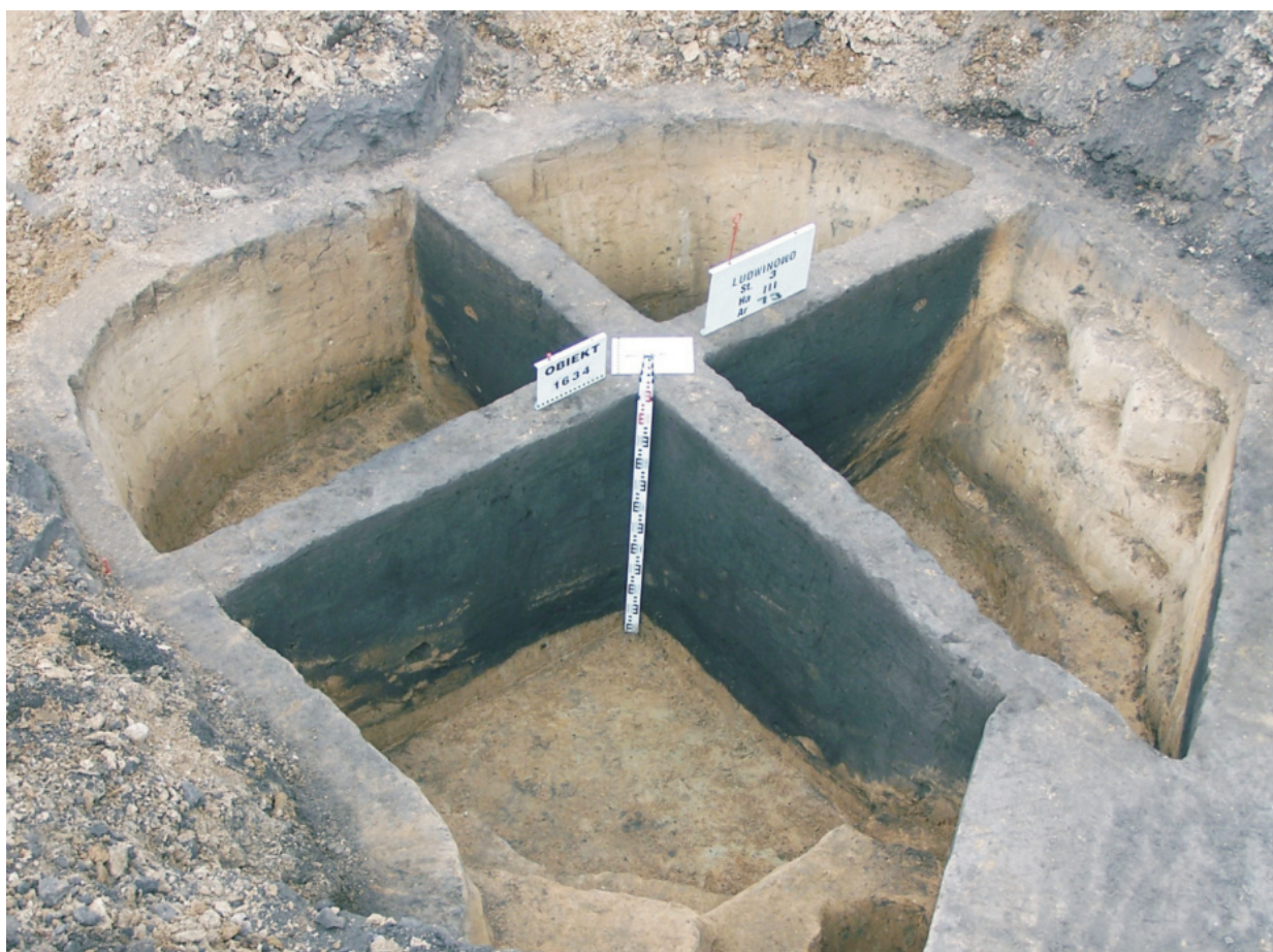
Fot. 32. Ludwinowo, stan. 3, pow. Włocławek. Obiekt 1634 – jama gospodarcza z późnego średniowiecza.