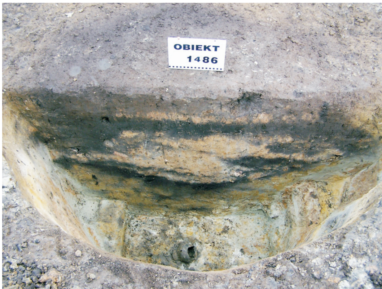
Fot. 19. Ludwinowo, stan. 3, pow. Włocławek. Obiekt 1486 – studnia kultury pucharów lejkowatych, z zachowaną amforą na dolnym poziomie wypełniska.