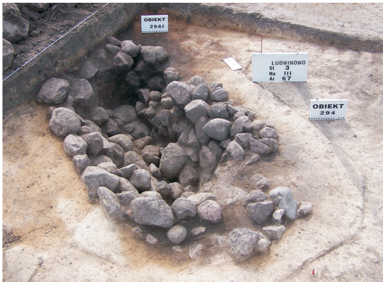
Fot. 21. Ludwinowo, stan. 3, pow. Włocławek. Obiekt 294 – grób z późnego okresu halszackiego z elementami południowo-wschodnimi.