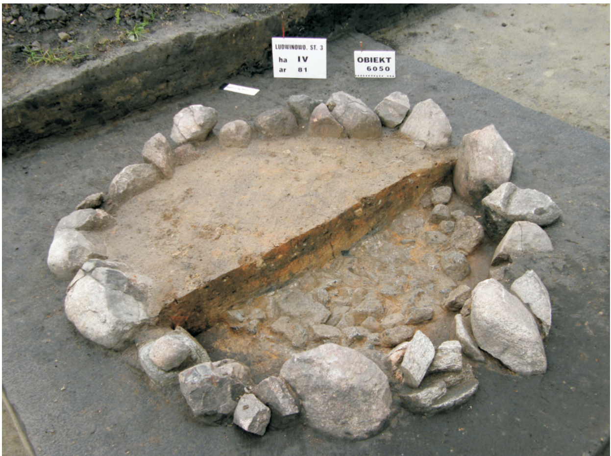
Fot. 30. Ludwinowo, stan. 3, pow. Włocławek. Obiekt 6050 – wapiennik kultury przeworskiej.