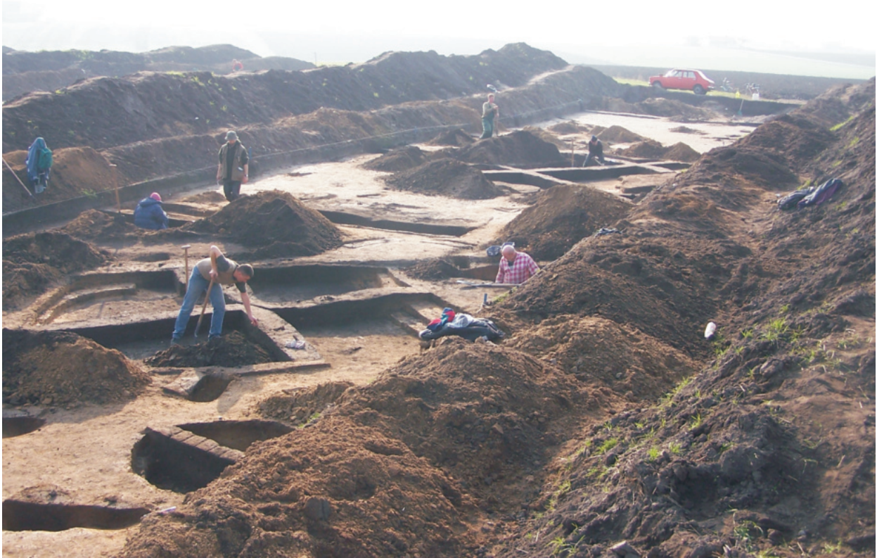
Fot. 7. Ludwinowo, stan. 3, pow. Włocławek. Prace eksploracyjne na wykopie w trakcie badań w 2004 roku.