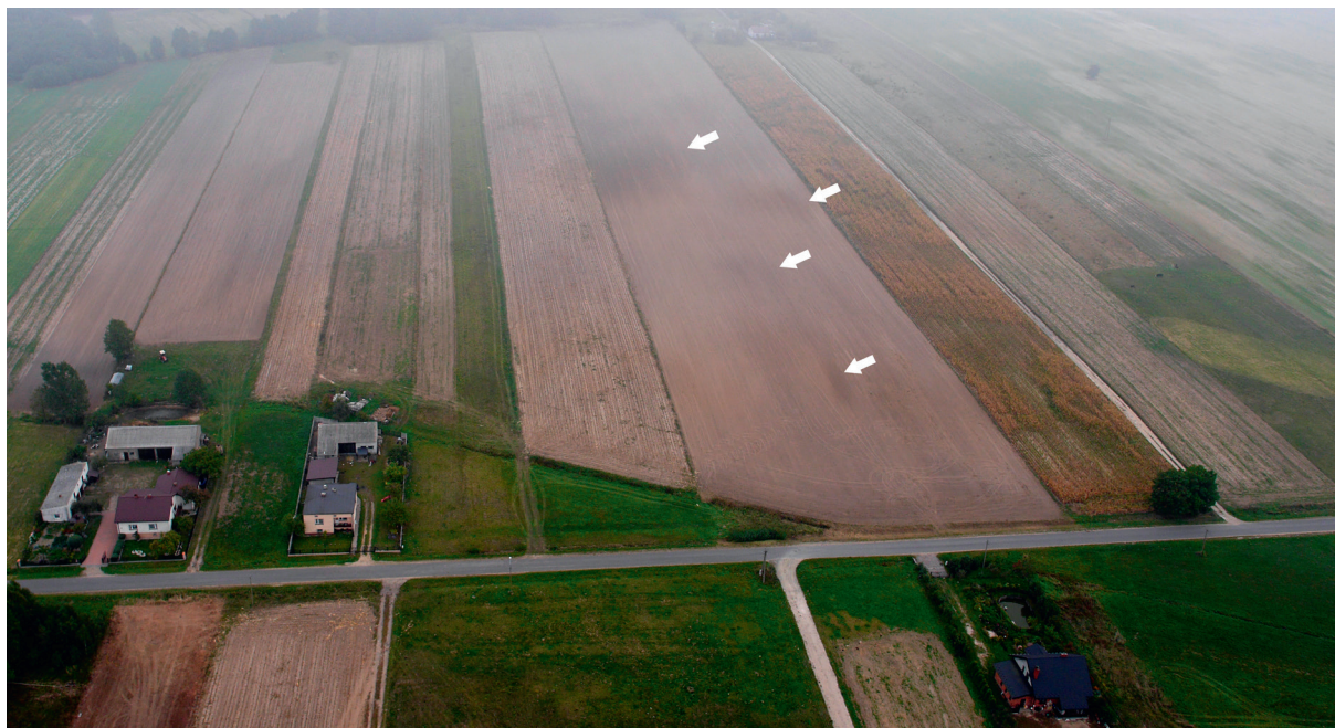
Ryc. 152. Kolonia Rychłocice stan. 1, pow. Wieluń, woj. łódzkie. Grupa wyróżników glebowych w odległości około 500 m na wschód od stanowiska.