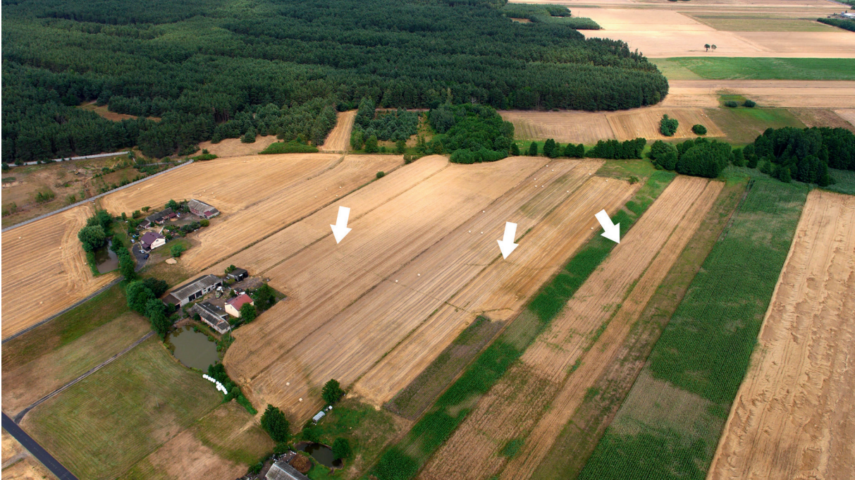
Ryc. 151. Kolonia Rychłocice stan. 1, pow. Wieluń, woj. łódzkie. Przebieg fortyfikacji polowych z 1944 roku.