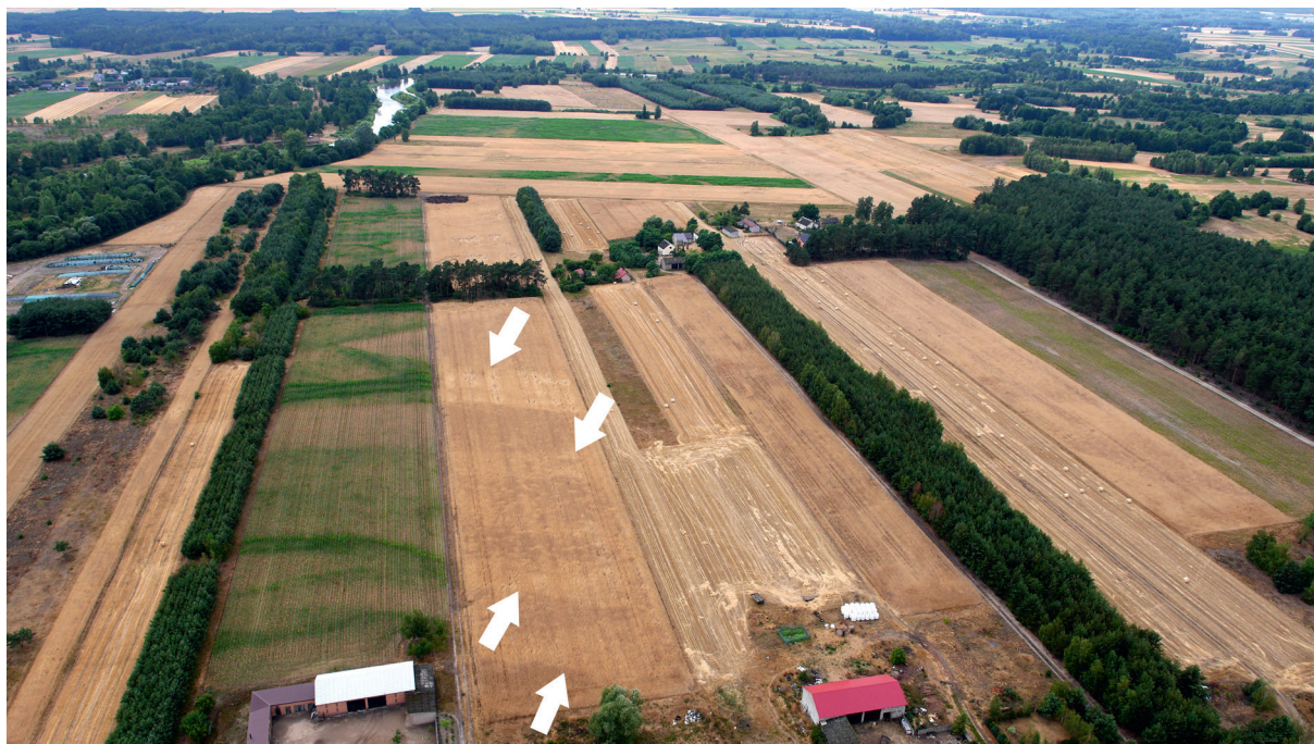
Ryc. 150. Kolonia Rychłocice stan. 1, pow. Wieluń, woj. łódzkie. Wyróżniki wegetacyjne wskazujące na lokalizację poszczególnych kopalnych koryt rzecznych.