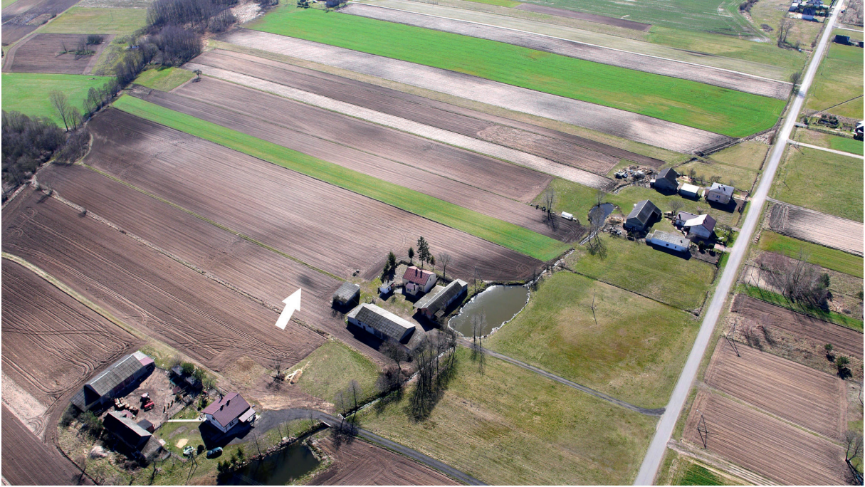
Ryc. 149. Kolonia Rychłocice stan. 1, pow. Wieluń, woj. łódzkie. Wyróżnik glebowy w odległości około 350 m na wschód od stanowiska.