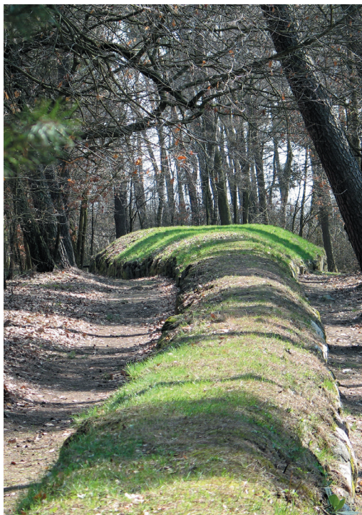
Wietrzychowice, grobowiec nr 3 – stan z 28.09.2010 r.