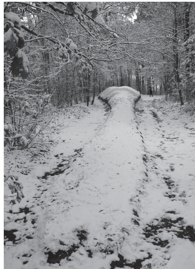
Wietrzychowice, grobowiec nr 1 – stan z 22.11.2005 r.

Rozporządzenie Prezydenta RP z 1928 roku zobowiązywało władze konserwatorskie do prowadzenia rejestru zabytków, a sposób jego prowadzenia miał określić rozporządzeniem Minister Wyznań Religijnych i Oświecenia Publicznego (art. 4). Minister, 17 lipca 1928 roku, ogłosił rozporządzenie o prowadzeniu rejestru zabytków, w którym zarządził jego prowadzenie w każdym urzędzie wojewódzkim. Po-