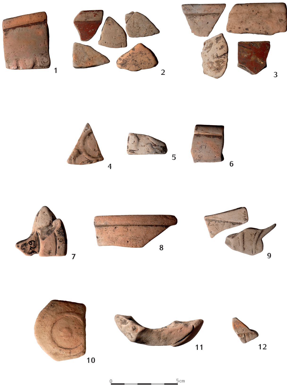
Ryc. 83. Łęki Majątek stan. 2A, pow. Kutno. Ceramika terra sigillata z cmentarzyska warstwowego.